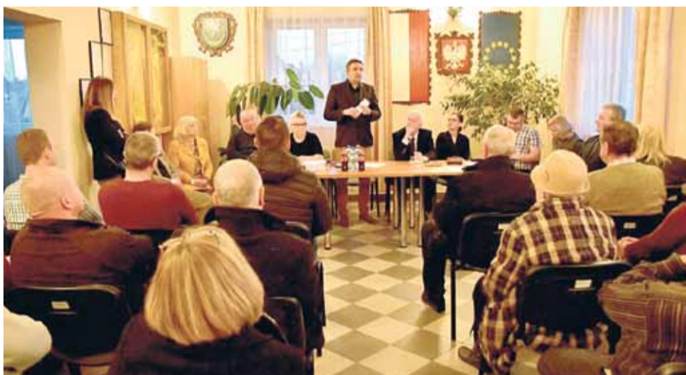
Spotkanie z mieszkańcami osiedla Miechocin.

Podczas wszystkich czterech spotkań mieszkańcy poruszali szereg, ważnych dla ich miejsca zamieszkania spraw, m.in.: remonty kolejnych ulic, tworzenie dodatkowych miejsc parkingowych, przejęcie dworca PKP i jego