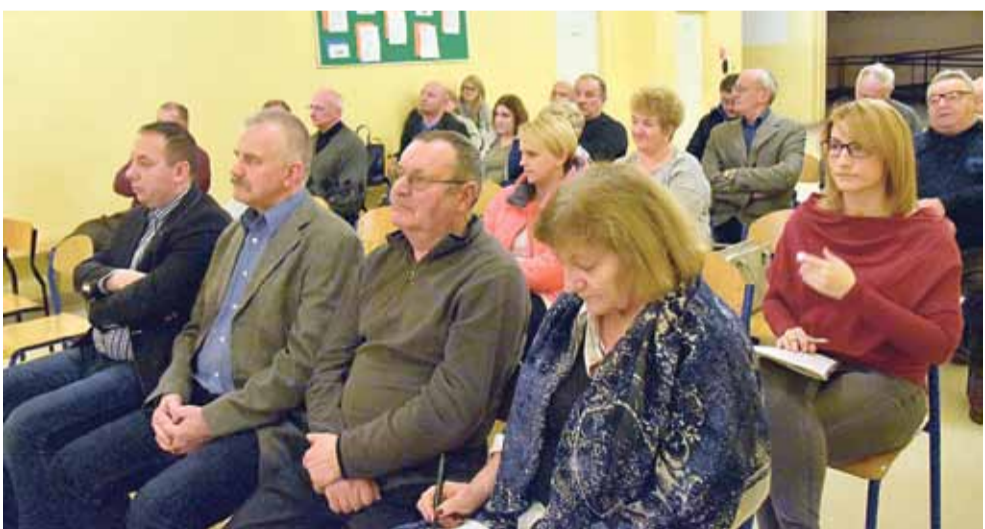
Spotkanie z mieszkańcami osiedla Siarkowiec.

nobrzесkie Wodociągi Sp. z o.o. za kwotę 25 ml zł. Pozyskane w ten sposób środki finansowe będą mogły być zainwestowane w remont ulic Żeglarskiej i Plażowej oraz dróg na terenie strefy poprzemysłowej w Machowie. Tarnobrzесkie Wodociągi Sp. z o.o. wykupią swoje akcje w ciągu 25 lat.